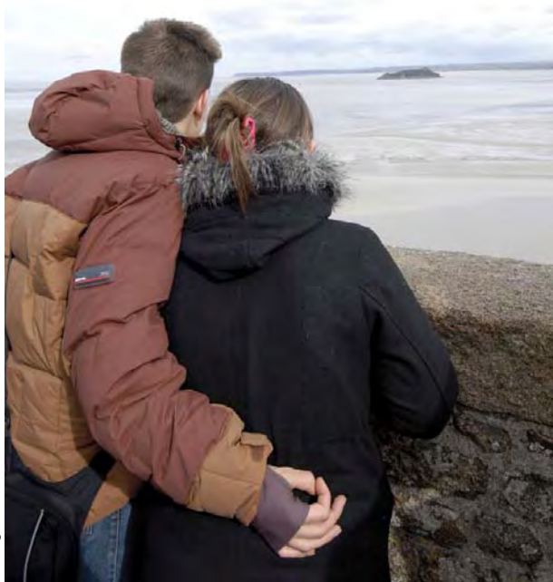
A. Pinoges / CIRIC

« Si un homme commence avec des certitudes, il finira avec des doutes ; mais s'il commence avec des doutes et qu'il est patient avec eux il finira avec des certitudes. » Sir Francis Bacon