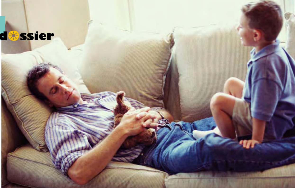
Responsable et actif, certes, mais avec des pauses !