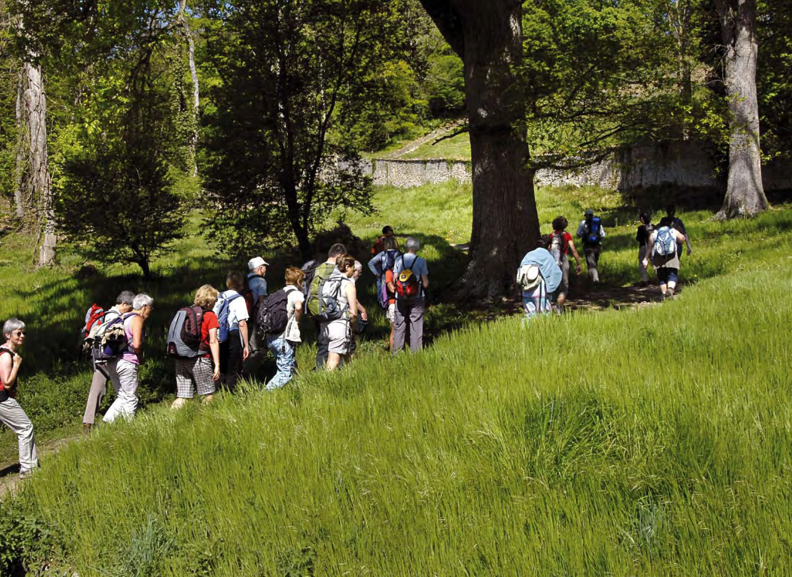
A tout âge de la vie, on est toujours en marche.

matique est à la mode dans les émissions télévisées; le principe de précaution règne en maître, la chasse au risque devient une dictature, en concomitance avec des campagnes publicitaires pour toutes sortes d'as-