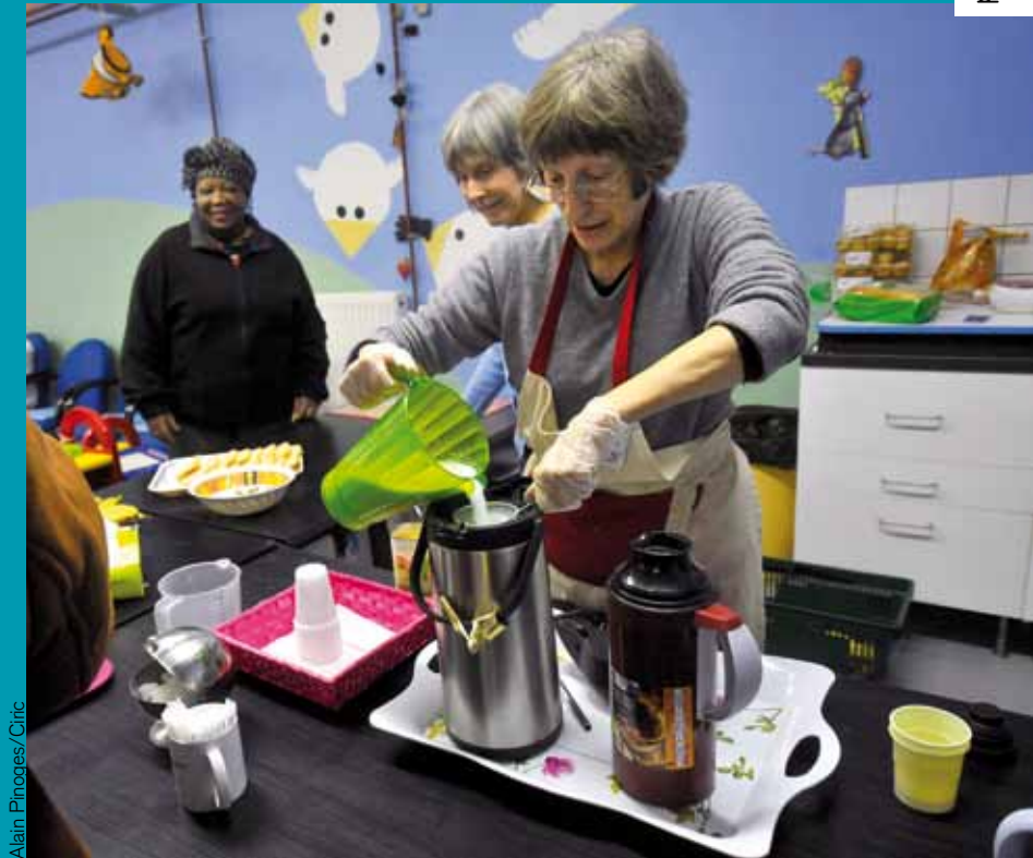
Les Restos Bébés du Cœur.

Cette notion remplace aujourd'hui celles de fraternité ou d'altruisme, plus abstraites, et le mot « charité », qui appartient au passé et que l'on soupçonne maintenant d'être condescendant.