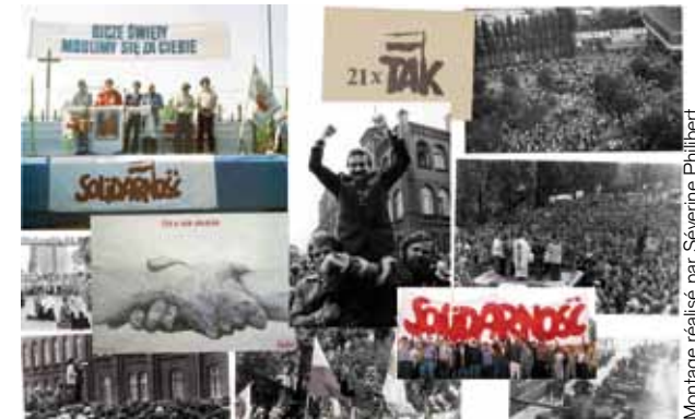
Montage réalisé par Séverine Philibert

Le 14 août 1980, suite au licenciement d'une ouvrière des chantiers navals, la grève éclate à Gdansk en Pologne, et donne naissance au syndicat Solidarnosc le 31 août 1980. Personne à l'époque ne pouvait imaginer que ce mouvement allait changer la face du monde. Un an plus tôt, lors de son premier voyage à Varsovie en juin 1979, le pape Jean-Paul II avait prononcé quatre mots qui firent frémir le bloc soviétique: « N'ayez pas peur! ». Forts de cet encouragement de l'ancien archevêque de Cracovie, les Polonais entamèrent une grève qui se termina presque dix ans plus tard avec les premières élections libres en Europe de l'Est, la réunification de l'Allemagne et le démantèlement du rideau de fer (1989). Le 13 décembre 1980, le général Jaruzelski proclame l'état de guerre qui met Solidarnosc hors la loi, mais le syndicat poursuit ses activités, soutenu à l'intérieur du pays par les intellectuels, l'Église, les étudiants et l'ensemble des adversaires du régime. Grâce à un courage, un patriotisme et une foi en Dieu infinis, ils feront tomber le communisme. En attendant, la répression fut sanglante. Des milliers de partisans furent arrêtés et internés. Jerzy Popieluszko, prêtre très lié au mouvement, fut enlevé et torturé. On retrouva son corps dans la Vistule (1984). Il devint un martyr. Un réseau de soutien