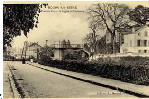
La dernière demeure de Péguy, 7 rue André-Theuriet à Bourg-la-Reine (à droite sur la photo).

Il y a enfin l' humour proprement dit, non plus l'humeur agressive mais le regard lucide et détaché sur les contradictions plaisantes du moi et du réel. C'est pour Péguy l'art de se mettre en scène et de s'observer à distance, quitte à dévoiler sa fragilité pour faire rire aussi de lui-