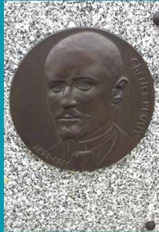
Charles Péguy, médaillon au cimetière de Bourg-la-Reine