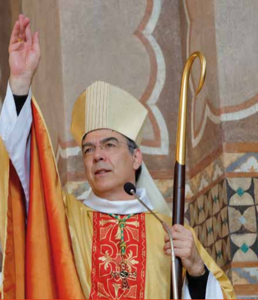
Diocèse de Nanterre