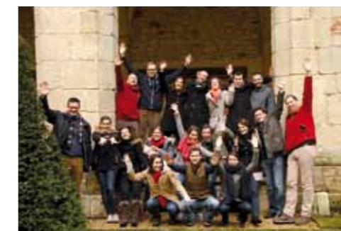
Les Dei Amoris Cantores.

Le titre choisi pour leur album, Sauvé , sorti le 6 juin 2014, cristallise le message d'espérance qui les anime. À lui seul, ce simple adjectif suffit en effet à proclamer le kérygme dont les Apôtres furent institués les bienheureux dépositaires lors de la Pentecôte. Il nous parle de la compassion infinie de Dieu pour ce