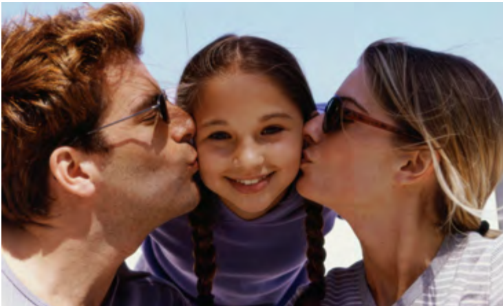
La base de la construction d'un enfant, c'est l'amour.

N ous souhaitons transmettre à nos enfants ce qui leur permettra de vivre leur vie avec ses joies et ses difficultés, tout en étant heureux et responsables. Bien sûr, cela n'est possible qu'avec l'amour, un amour responsable qui ne cherche ni le plaisir de l'enfant, ni une reconnaissance pour nous parents, mais uniquement son bonheur... car oui, il y a une grande différence entre le plaisir et le bonheur.