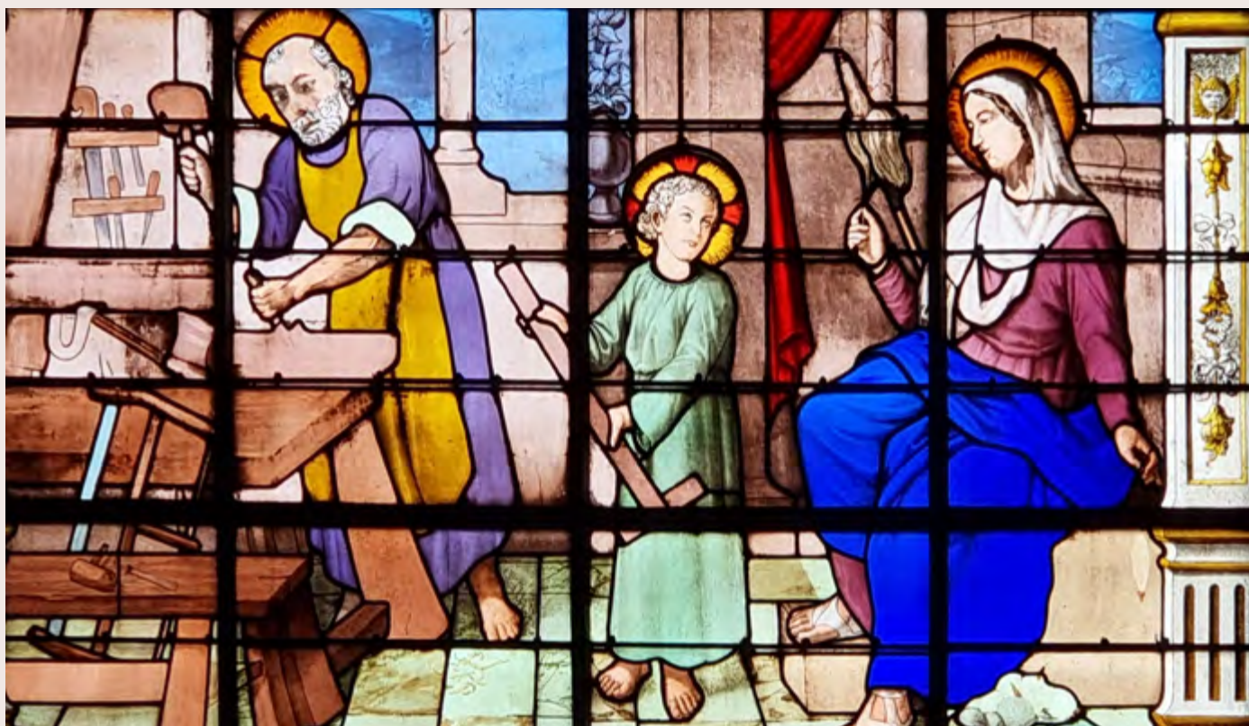
Vitrail de saint Joseph charpentier, église Saint-Gilles de Bourg-la-Reine.