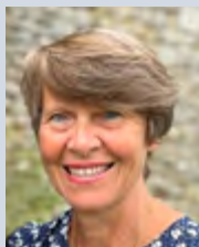
PAR MARION DENORMANDIE, RÉDACTRICE EN CHEF

Vivre vraiment est-il autre chose qu'aimer ? Et aimer porte vers l'autre, les autres, et pousse à la rencontre, au partage, au désir de transmettre aussi.