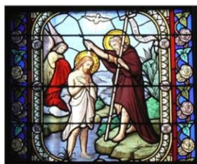
Jésus, PAROLE, au milieu de nous.

Note : les « Partages de l'Évangiles » sont sans inscription ni obligation d'assiduité.