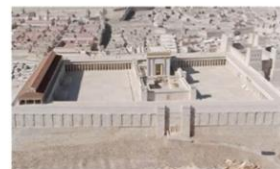
Le Temple de Jérusalem au temps de Jésus

Dans les locaux de la paroisse Saint Gilles, 8 boulevard Carnot, 92340 Bourg la Reine. Une verre de l'amitié ( casher) sera servi à l'issue de la conférence.