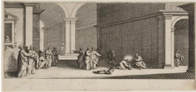
Jacques Callot, Le Lavement des Pieds , 1619. Musée des Beaux-Arts de Nancy

Nous fêtons cette année, le 1700 e anniversaire du Credo de Nicée Constantinople qui définit le Christ comme vrai Dieu / vrai Homme, ses deux natures n'étant ni séparées, ni confondues.