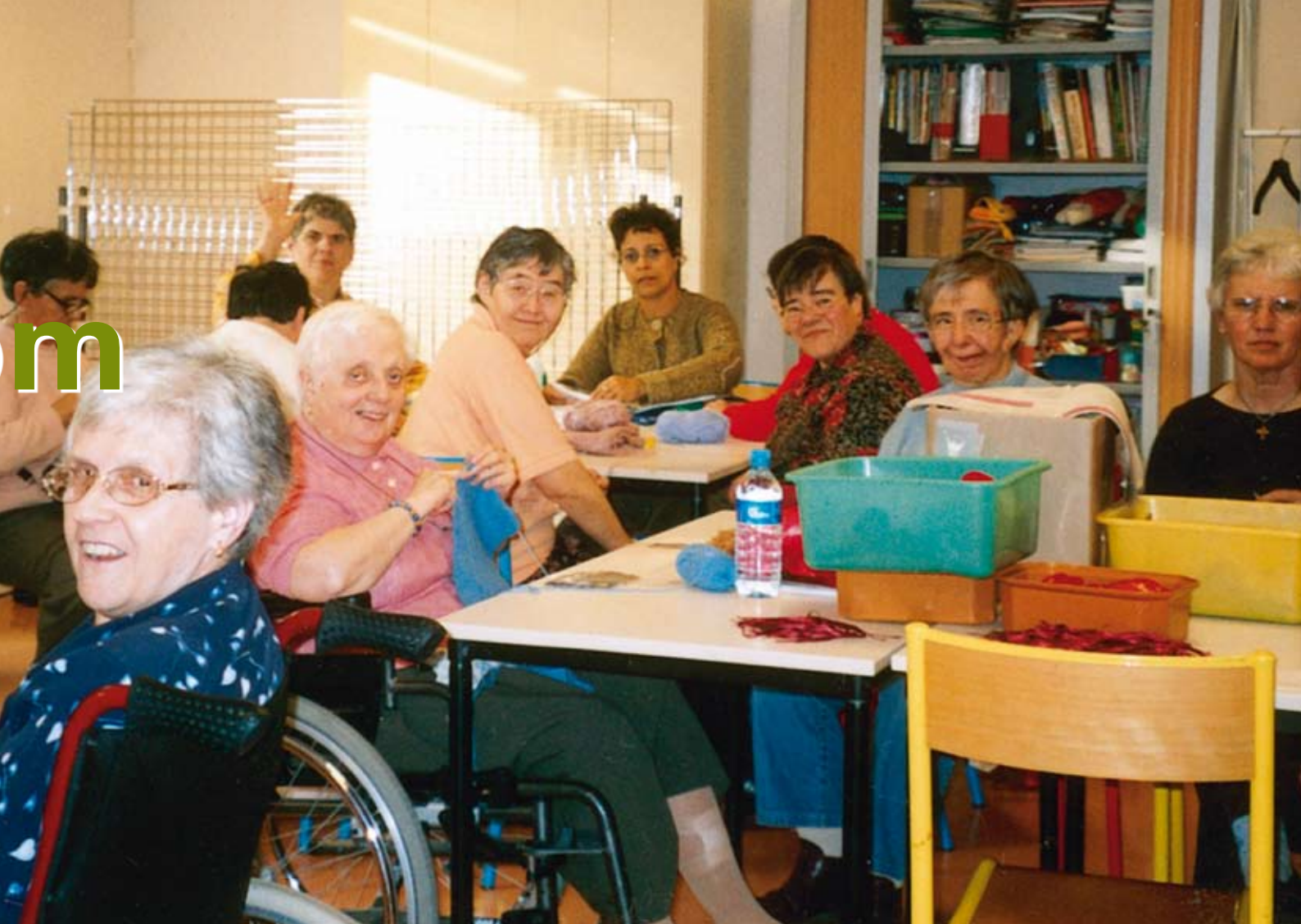
Les résidentes du foyer Notre-Dame (Bourg-la-Reine) adorent communiquer !

sens sont déficients ? Devant toutes les théories de la communication que développent les sciences humaines, nous parlerons autant de communication individuelle que de communication sociale. Quel que soit le plan sur lequel on se place, il s'agit d'un processus dynamique dans lequel le récepteur conserve sa liberté de dire non, ce que souligne d'ailleurs Dominique Wolton. Les chrétiens l'ont intériorisée depuis toujours : c'est la même liberté que nous laisse le Christ de l'écouter ou non. Le message du Christ, contenu tout en entier dans le « aimez-vous les uns les autres comme je vous ai aimés » (Jn, 13, 34) n'est-il pas d'une certaine façon le modèle d'une communication réussie, parce qu'incluant