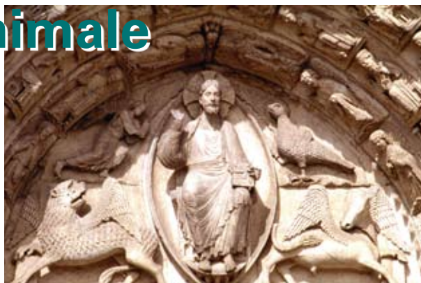
Un exemple de tétramorphe sur le tympan du portail royal de la cathédrale de Chartres.

On appelle « Tétramorphe » la représentation symbolique des quatre « vivants » qui entourent le trône de Dieu et que voit saint Jean au début de l'Apocalypse (4, 7-8) : le lion pour Marc, le taureau pour Luc, l'homme pour Matthieu et l'aigle pour Jean. Ce thème accompagne fréquemment la représentation du Christ en gloire dans nos églises, aussi bien dans les sculptures des tympans ou chapiteaux que dans les fresques, souvent moins bien conservées.