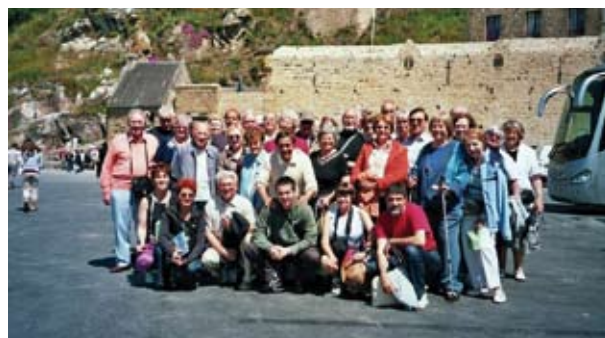
Venus d'Allemagne, d'Angleterre, de Roumanie, de Pologne et de France, 63 participants ont fêté en 2008 les 25 ans de jumelage avec Kenilworth, ici au pied du mont Saint-Michel.

Mais quelles découvertes dans tous les domaines : la vie de famille, la vie scolaire, l'art, la culture, le sport ! C'est l'occasion de confronter les mentalités et de mieux se situer par rapport à l'Europe. Nos amis polonais ou roumains envient notre niveau de vie élevé, nos lois sociales, l'entretien de nos lieux publics et nous leur expliquons que le "paradis de l'Ouest" est une redistribution consciente, une solidarité obligatoire et contraignante. C'est aussi l'occasion de rompre avec les idées reçues : nous rencontrons des Anglais ouverts et chaleureux, des Roumains cultivés, un peuple fier, aux antipodes de l'image donnée par les femmes roms qui mendient sur nos trottoirs.