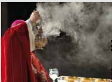
Alain Pinoges / CIRIC