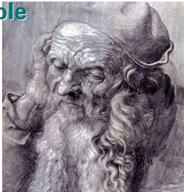
Tête d'un homme de 93 ans, par A. Dürer

Mais plus souvent, le simple fait de vivre longtemps est présenté comme une bénédiction de Dieu et le