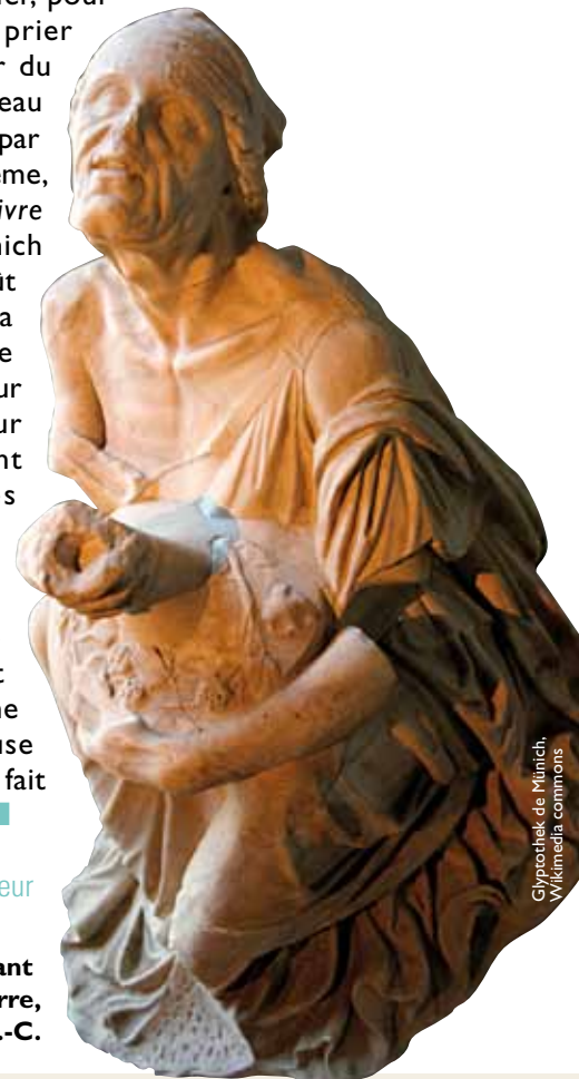
Glyptothek de München, Wikimedia commons

Vieille femme ivre serrant contre elle une jarre, 200-180 avant J.-C.