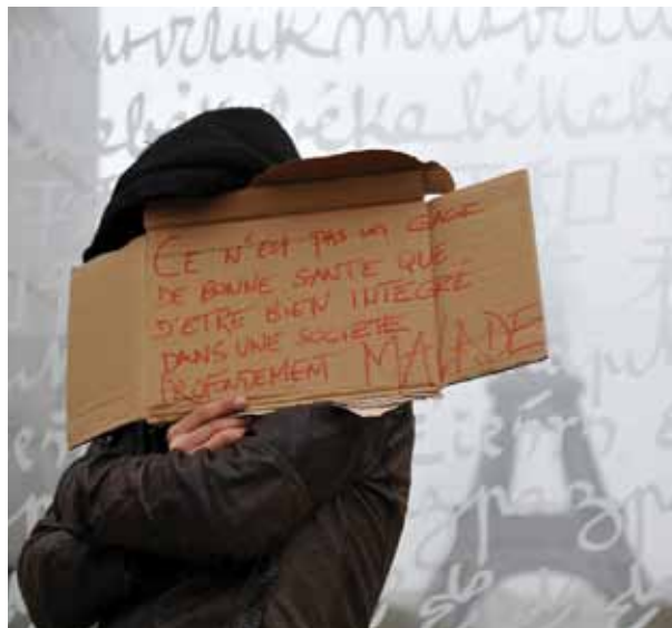
Alain Pinoges / Cric

Parallèlement à cette angoisse du pire qui est de fait une projection négative dans l'avenir, notre époque développe une religion du présent qui lui fait fuir toute forme d'engagement, lequel suppose une confiance dans le futur. Cela est particulièrement vrai en ce qui concerne les choix de vie fondamentaux. Si l'on se marie moins à l'église, si l'on choisit moins la vie religieuse, c'est que l'engagement pour la vie fait peur. D'aucuns disent qu'à notre époque la vie est devenue trop changeante et trop longue, que ne pas admettre la possibilité de changer est contre-nature. D'autres répondent que seuls ceux qui ont eu la persévérance et le courage