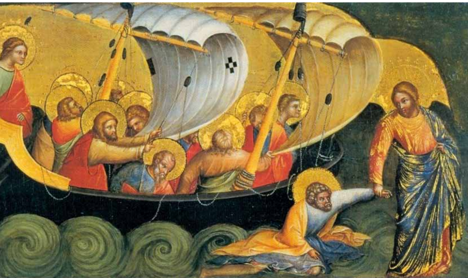
Le Christ sauvant Pierre des eaux, Lorenzo Veneziano, 1370. Gemäldegalerie, Berlin

Vivre à l'abri du risque, l'ignorer, le réduire, le domestiquer, l'accepter pleinement, le rechercher pour lui-même, nos attitudes varient d'une personne à l'autre, d'une époque à l'autre. Comment nous situons-nous par rapport au risque ?