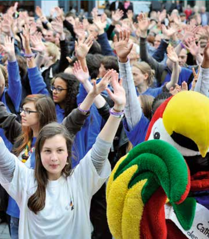
19 mai 2013 : Flash' Mob de la Fraternité sur le parvis de la cath. Notre Dame de la Treille, lors de Pentecôte 2013. Le diocèse de Lille fête ses 100 ans. France.