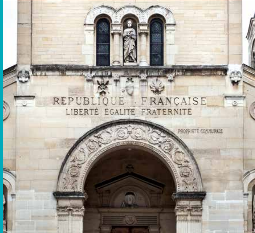
5 janvier 2019 : Fronton de l'église de Saint Pierre de Charenton Le Pont sur lequel est inscrit « République française, liberté, égalité, fraternité ». Charenton Le Pont (94), France.

crit dans ce moment. Des lois sociales font pour la première fois état d'un droit fondant les droits personnels et collectifs des citoyens